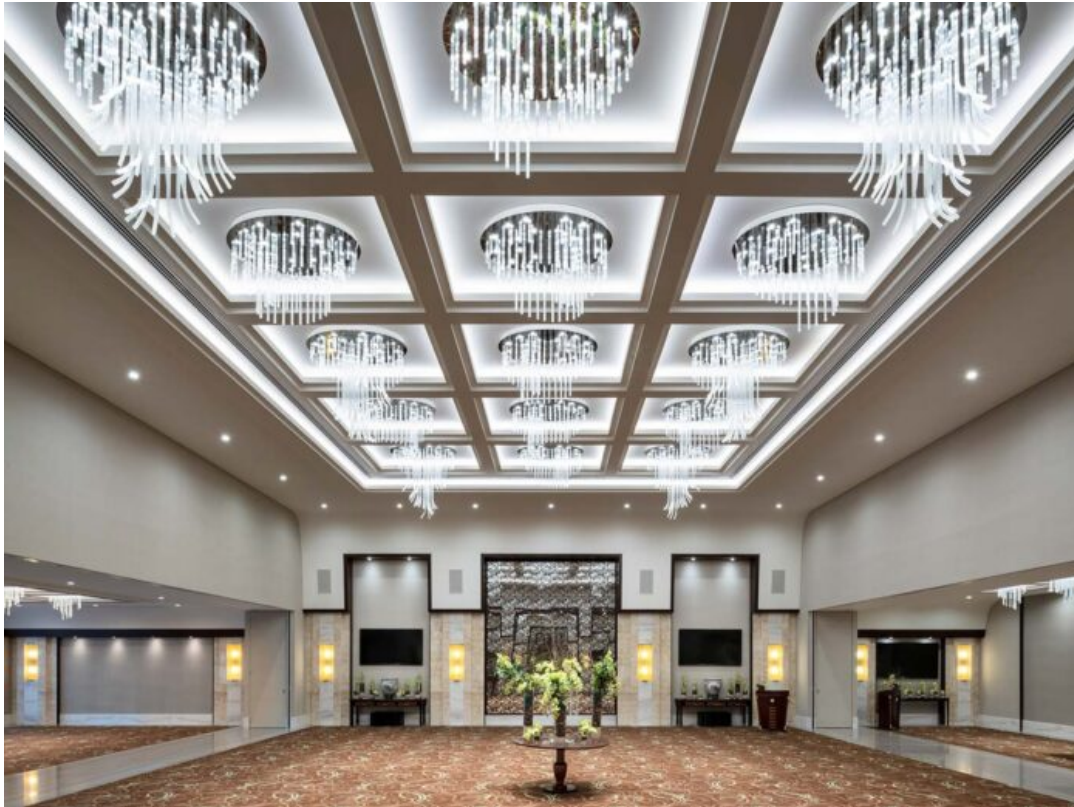
Grand Millennium Hotel

Nexo Luce è una realtà italiana con una visione e un appeal internazionale, grazie anche alla sua filiale a Dubai, negli Emirati Arabi Uniti. Specializzata nella realizzazione di prodotti illuminotecnici, l'azienda si differenzia per una versatilità intesa sia nel modo di lavorare, collaborando con designer e architetti esterni o appoggiandosi al proprio team interno, che per la destinazione, residenziale o contract. Nexo Luce sposa inoltre a tutti gli effetti la filosofia del Made in Italy assemblando le proprie creazioni artigianalmente nella propria sede produttiva nel mantovano.