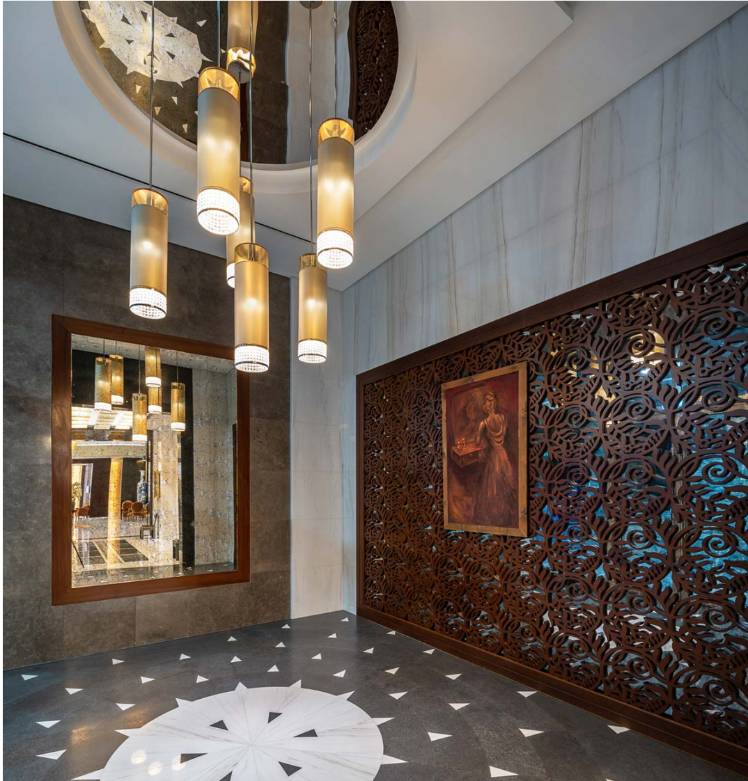
Grand Millennium Hotel

Nexo Luce ha fornito le illuminazioni interne ed esterne. Quest'ultime hanno coperto le quattro facciate dell'hotel evidenziandone i dettagli architettonici, il paesaggio, i percorsi pubblici, i ponti della piscina e la rampa del parcheggio. Per l'interior ci siamo occupati dell'illuminazione tecnica e decorativa, inclusi spazi pubblici, hall, punti vendita, sala da ballo, sale riunioni, palestra e spa, suite, corridoi delle camere e aree bar.