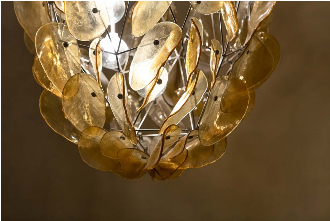
Grand Millennium Hotel