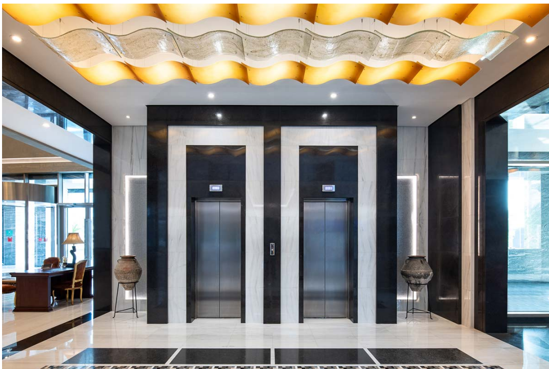
Grand Millennium Hotel

Le prospettive generali per la crescita del Medio Oriente nei settori del turismo e dell'ospitalità rimangono positive. Tra i paesi del CCG (Consiglio di cooperazione del Golfo), gli analisti affermano che gli Emirati Arabi Uniti continuano a mostrare il massimo potenziale di crescita e con l'imminente Expo 2020 sono previsti 25 milioni di visitatori internazionale. Ciò rappresenta una grande opportunità per Nexo Luce di farsi conoscere e continuare a lavorare su progetti di ospitalità e residenziali su larga scala nella regione.